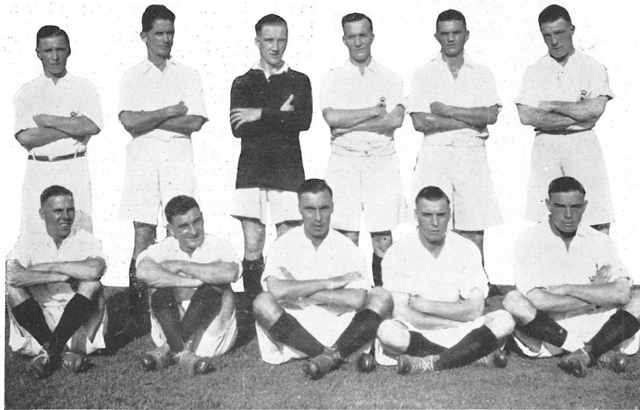
1928. De tour der „Duke's” over Java. De spannendste wedstrijd was wel die tegen Hercules, door de Dukes met 1—0 gewonnen.

N. V. Handel Maatschappij „EUROPA-AZIË” — Afdeeling Zeilmakerij. Goenoeng Sahari 37 en 66 — Telefoon Batavia-Centrum 923-924 TENTEN — SPORTARTIKELEN en alles op het gebied der Zeilsport