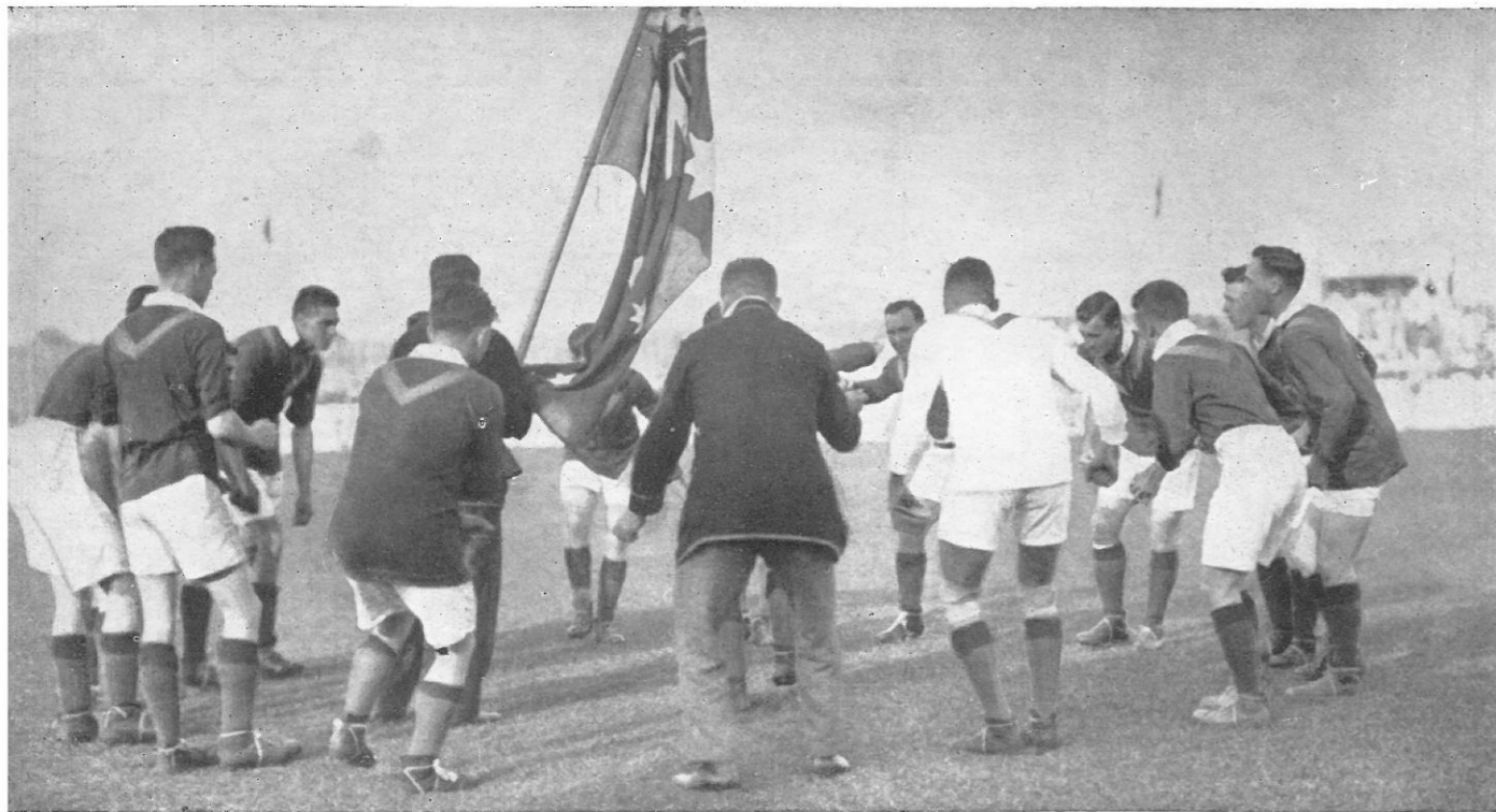
1928. „Rah Rah, reyah jah-ja-ilah,” aldus de strijdkreet der Australiërs.